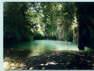
Cueva de los Angeles (Villamalea).