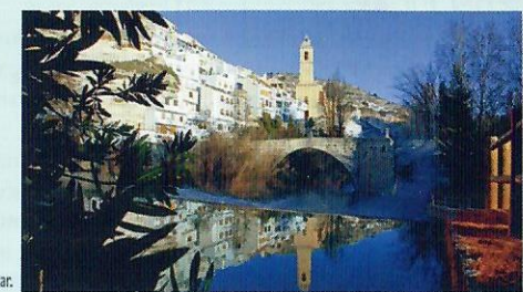
Alcaía del Júcar.